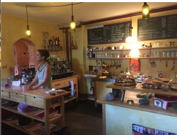
21 地下室的溫馨咖啡館