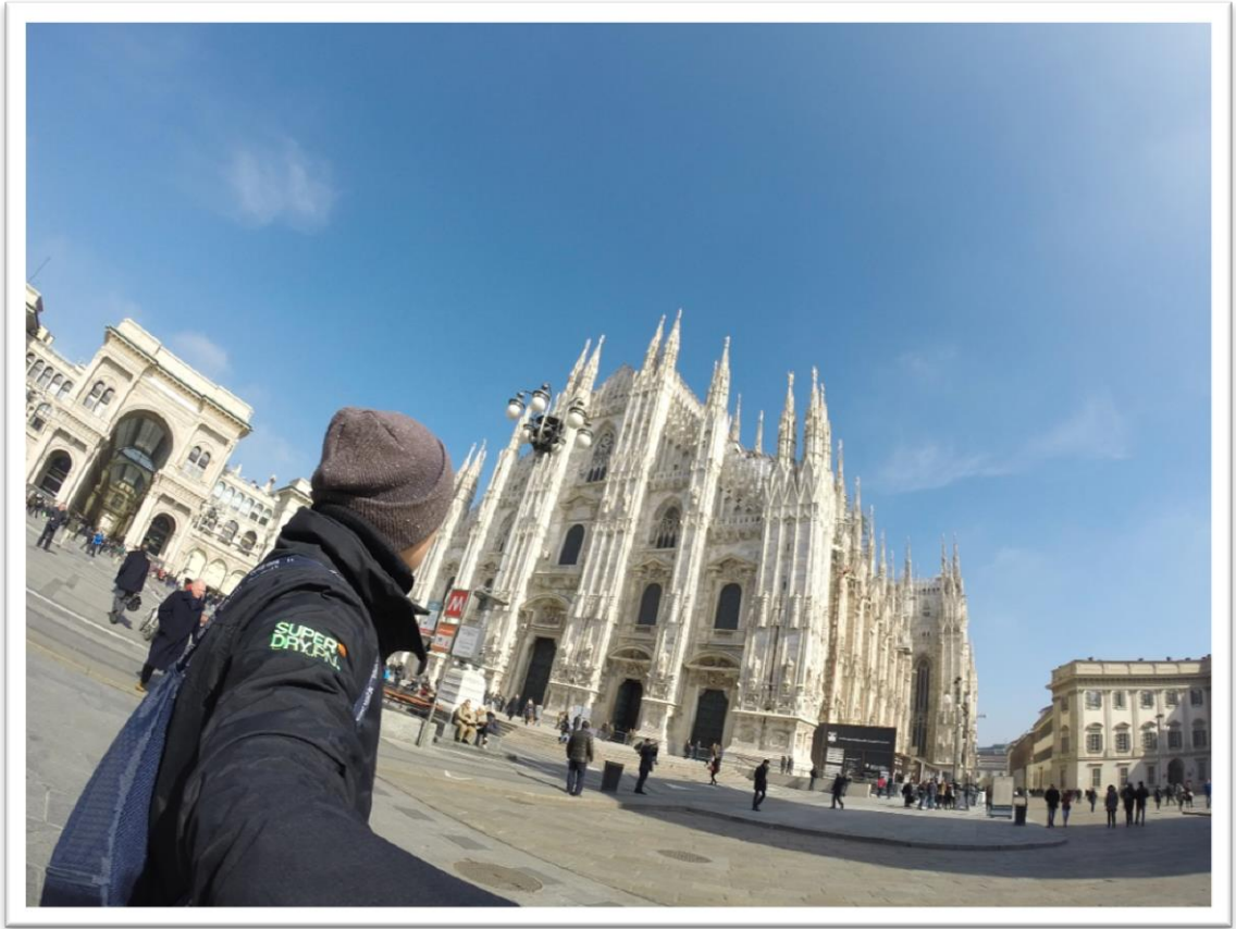
米蘭大教堂，世界第二大教堂，也是世界上最大的哥德式教堂，近距離看到米蘭大教堂或甚至上到大教堂的頂端讓我相當興奮。另外旁邊的艾曼紐二世迴廊的設計也相當特別。(Milan, Italy)