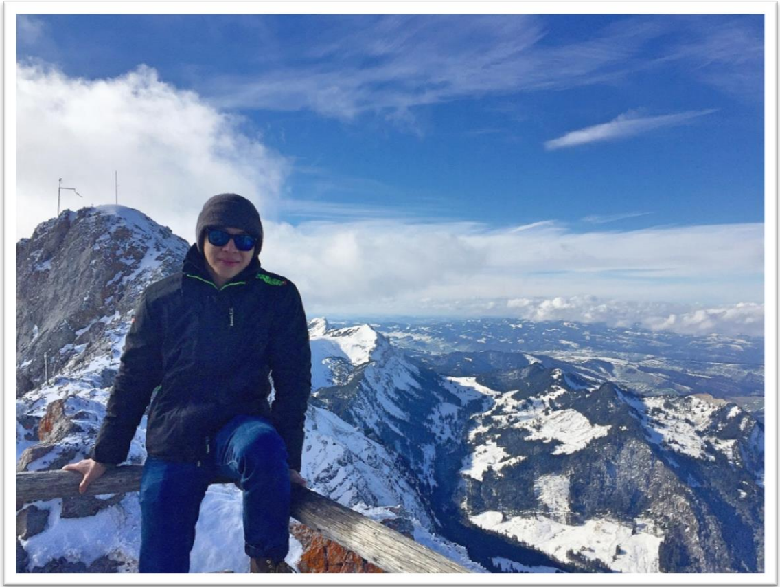
琉森皮拉圖斯山頂，傳說中火龍的住處。在山頂可以眺望整個城市的景色，也是我第一次見識到雪山的美麗。(Luzerne, Switzerland)