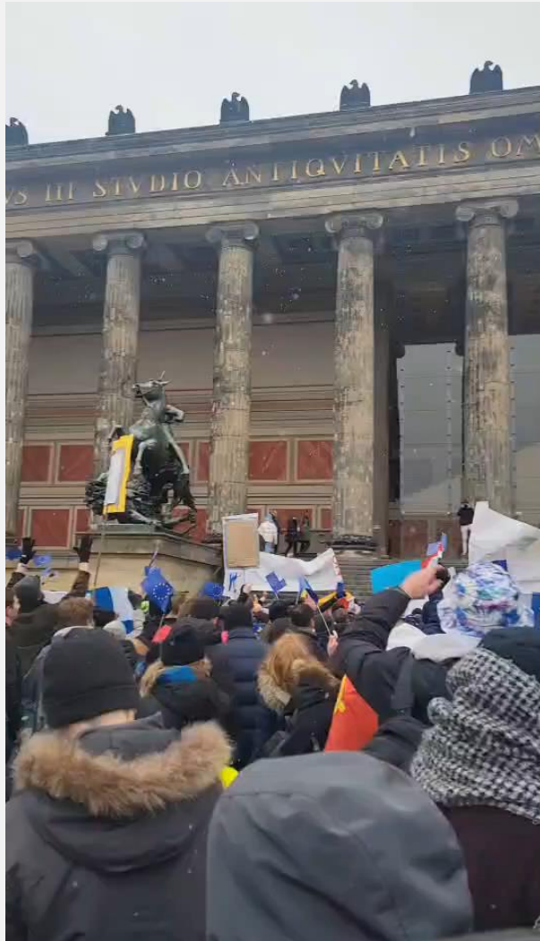
Berlin trip- Flag parade